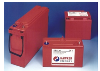
SBS C11 / 300 / 390