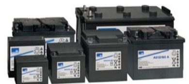
Blei Gel HoLi 512