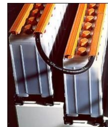
NiCd Modell TP